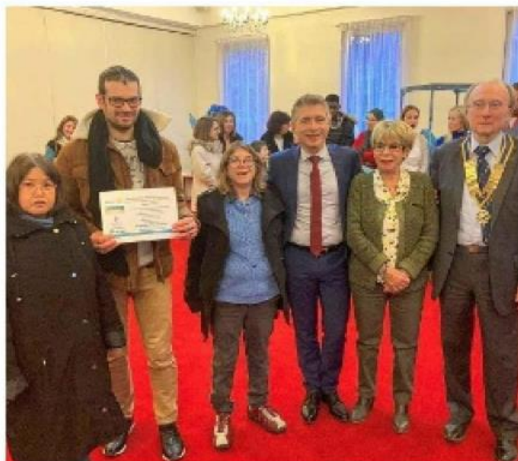
Les représentants d'Atout Brenne ont reçu leur prix des mains de Gil Avérous, président de Châteauroux Métropole.