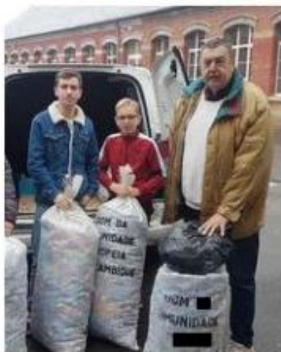
70 kilos de bouchons plastique en provenance de Beauquesne ont été déposés ce mercredi.

Régulièrement des temps de collectes sont mis en place pour les habitants de la commune et des alentours : « on les place volontairement le mercredi, jour d'ouverture du centre, pour que les enfants voient que les adultes aussi jouent