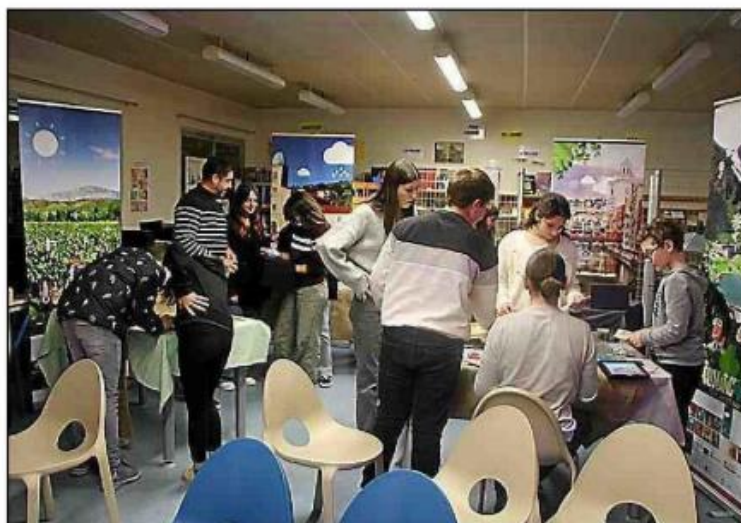
ClimaTic'tac, escape game ludique et éducatif.

des Pyrénées-Orientales, porte sur les effets du réchauffement climatique sur la santé. Financé par l'Agence régionale de santé (ARS) et le conseil départemental, ce projet a été adopté par les éco-délégués du collège Jules-Verne, représentants de classes allant de la 6 e à la 3 e . Ils étaient