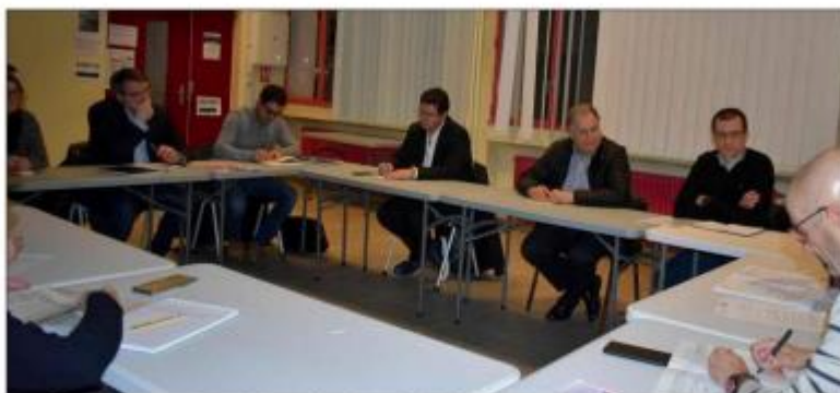
Les réunions se poursuivent, ici en décembre dernier à la Maison des associations avec de nombreux élus.

Un dossier qui traîne en longueur au goût de l'association chambonnaire. Une première réunion s'est tenue fin 2021, puis une seconde en février de l'année suivante réunissant