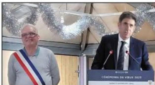
Le maire de Beuil et le président du conseil départemental.

Le docteur de profession a souhaité placer celui-ci sous le signe de la solidarité. Solidarité entre les villages du haut-pays niçois « pour qu'ils ne meurent pas », solidarité avec les réfugiés politiques, solidarité avec les professionnels du secourisme. Mais pas que... le premier magistrat a demandé à son auditoire que chacun réfléchisse à l'avenir de la montagne et notamment la place du ski et des activités purement montagnardes pour permettre aux villages tels que Beuil de renouer avec le