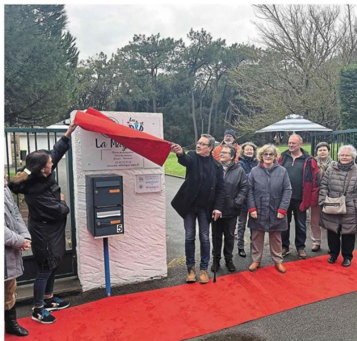
Le maire dévoile la nouvelle plaque qui atteste du changement de propriétaire du Centre de Vacances

LA TURBALLE. Le centre de vacances de La Marjolaine change. Ce terrain qui appartenait au Crédit Lyonnais est désormais la propriété intégrale du PEP.