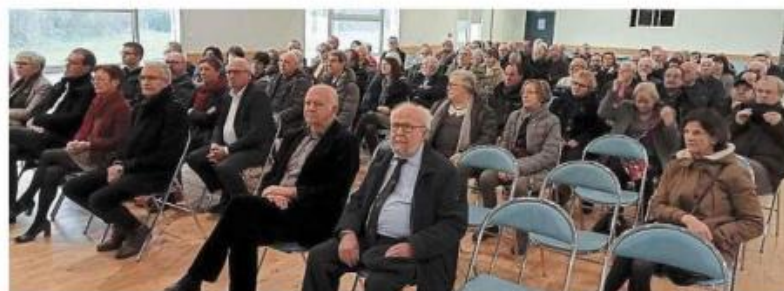
Les élus, anciens élus, ceux de la communauté de communes Aqta et les représentants d'associations ont constitué le public qui a assisté à la cérémonie traditionnelle des vœux du maire, Jean-Loïc Bonnemains.

Jean-Loïc Bonnemains, maire, et les élus ont animé la cérémonie des vœux, dimanche à la salle espace Les Chênes, en présence d'élus, d'anciens élus et des représentants d'associations de la commune.