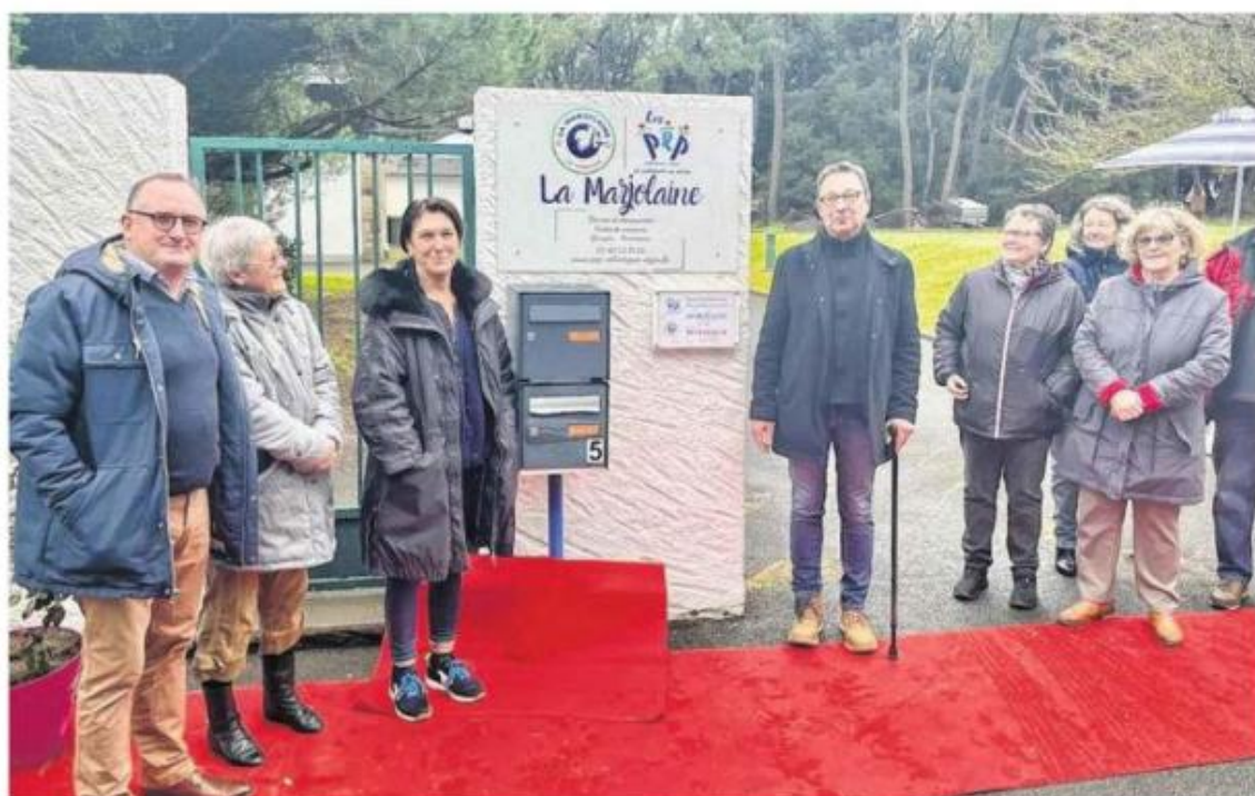
Propriétaires depuis le 14 décembre, après 31 ans de location, du centre de vacances de la Marjolaine, les PEP Loire-Atlantique — Anjou, vont maintenir le site en lieu d'accueil des enfants.

Avec 2,5 ha en plein cœur de La Turballe, le site propose des activités typiques du bord de mer, accessibles à pied ou à vélo et des séjours thématiques autour du théâtre ou des arts plastiques durant les périodes