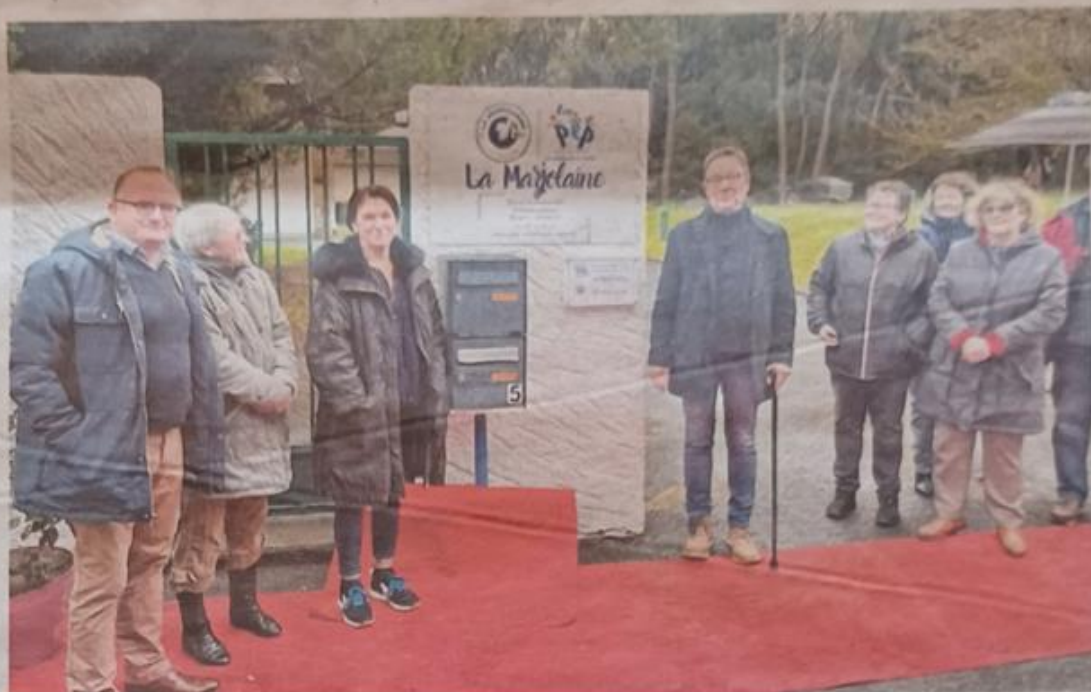
Propriétaires depuis le 14 décembre, après 31 ans de location, du centre de vacances de la Marjolaine, les PEP Loire-Atlantique — Anjou, vont maintenir le site en lieu d'accueil des enfants.

Avec 2,5 ha en plein cœur de La Turballe, le site propose des activités typiques du bord de mer, accessibles à pied ou à vélo et des séjours thématiques autour du théâtre ou des arts plastiques durant les périodes