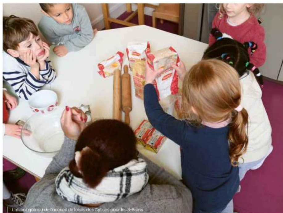
L'atelier gâteaux de l'accueil de loisirs des Cytises pour les 3-5 ans.

Les enfants inscrits aux accueils de loisirs de la Ville pendant les vacances de fin d'année ont pu bénéficier d'activités aussi variées qu'enrichissantes.