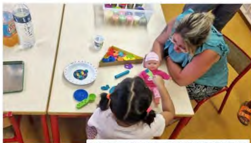
Deux élèves sont accueillis dans la nouvelle classe maternelle autisme située à Moulin-Voltaire, à Chaumont.

ENSEIGNEMENT. En cette rentrée de septembre 2022, une deuxième classe réservée aux enfants autistes a ouvert ses portes, à l'école maternelle Moulin-Voltaire, à Chaumont.