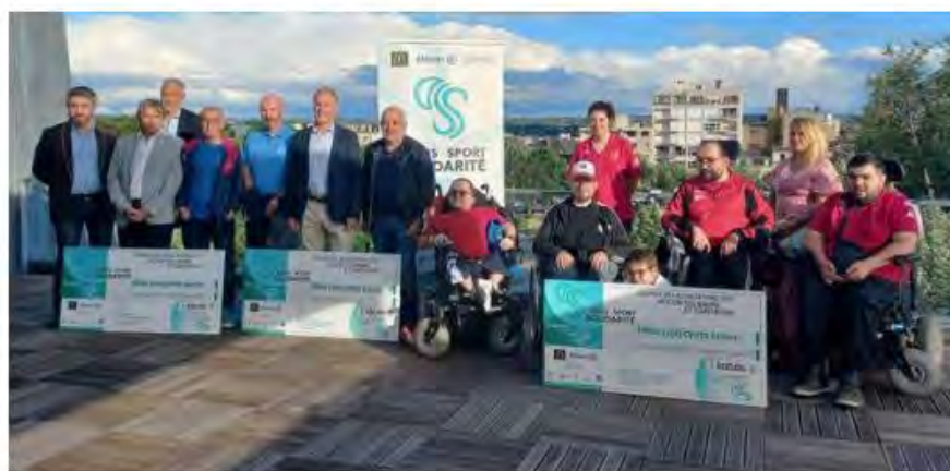
Les lauréats 2021.

L'appel à candidature des actions ou projets de nature à favoriser l'insertion sociale et professionnelle de personnes en difficulté grâce au sport est lancé.