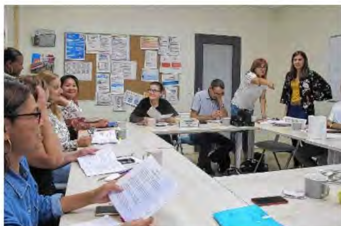
Hier, les ambassadeurs de la Chaîne des savoirs ont rencontré d'autres apprenants pour un après-midi d'échanges, au sein des locaux du Cria 36, rue du 11-Novembre à Châteauroux.

En 2017, Isabelle finit par pousser la porte du Centre ressources illettrisme et analpha-