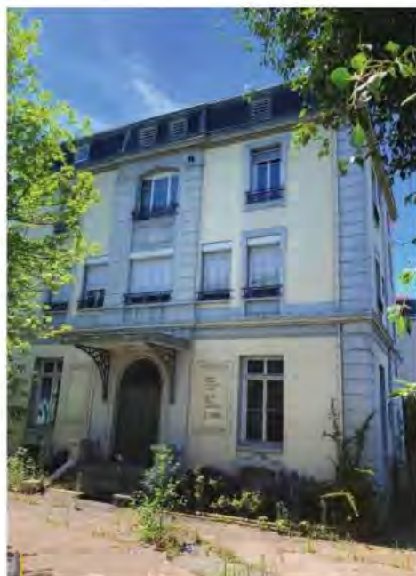
Le Geysier est situé avenue des Sources à Montrond-les-Bains