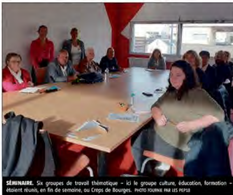
SÉMINAIRE. Six groupes de travail thématique – ici le groupe culture, éducation, formation – étaient réunis, en fin de semaine, au Creps de Bourges.

Cette première réunion sera suivie de deux autres rendez-vous en novembre et en janvier, avec les mêmes participants, avant la