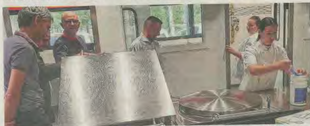
La nouvelle cuisine répond aux besoins des IME de recentrer leurs activités sur la restauration, ainsi que sur les espaces verts et la blanchisserie.

MONTCEAUX-LÈS-VAUDES. Deux ans de travaux et deux millions d'euros ont été nécessaires pour construire un nouveau bâtiment plus fonctionnel pour l'IME.