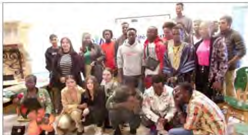
Les diplômés de l'année scolaire 2021-2022 ont été récompensés.