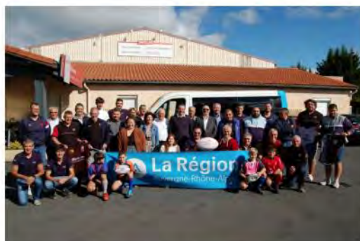
Photo de famille devant le coworking de Taulhac. Quelques jeunes rugbymen qui symbolisent la relève de ce sport qui a le vent en poupe en Haute-Loire.

Pour la Région, le président Laurent Wauquiez s'est dit fier de la famille rugby de Haute-Loire qui connaît une belle dynamique sur le territoire. Saluant l'initiative locale, il a souligné « qu'il faut planter des graines pour que les jeunes aient soif de rugby », et promis au passage des places au mondial pour chaque enfant des écoles de rugby.