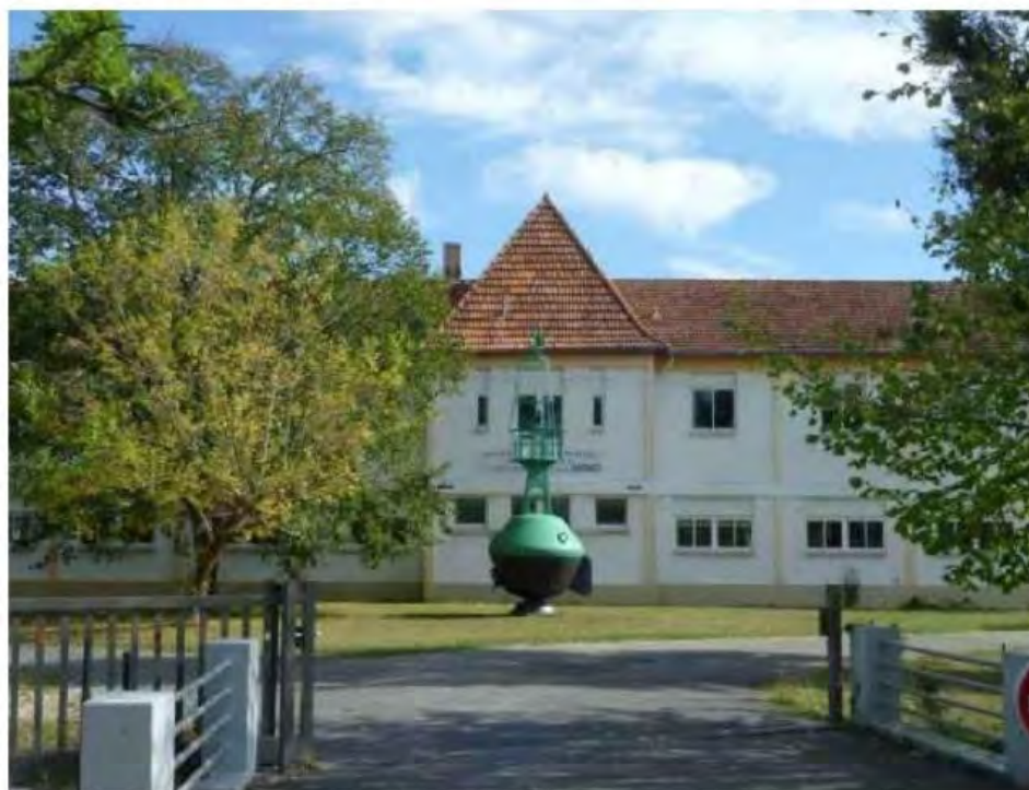
Le bâtiment des Pupilles de l'enseignement public. c.e.