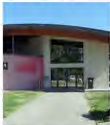
Le centre de remise en forme repris par Boost Center.