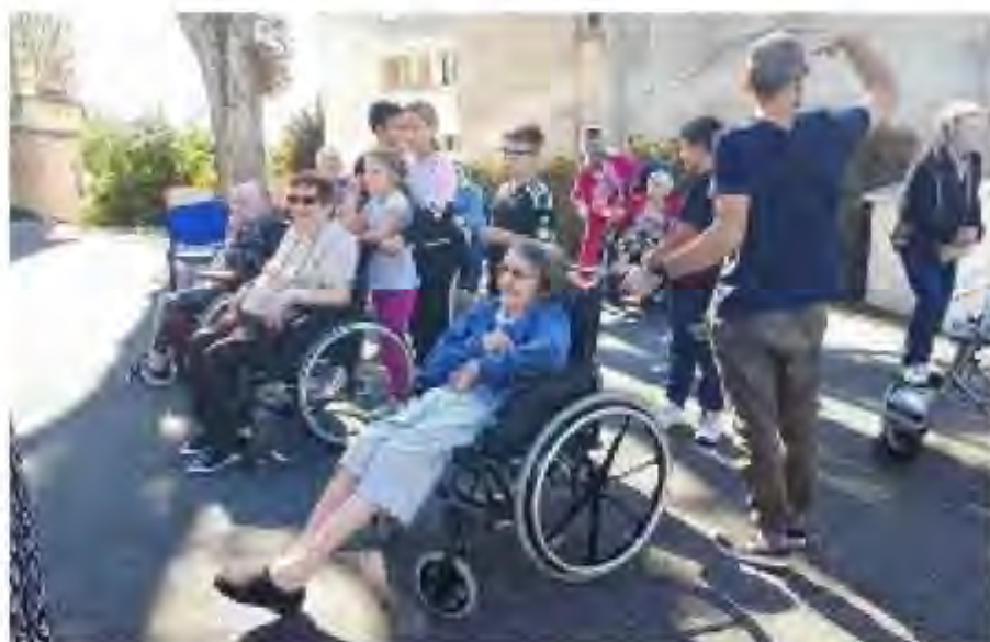
Les résidents de l'Ehpad Henry-Dunant en visite à l'Irecov.

Une dizaine de jeunes de 8 à 10 ans sont venus chercher quelques résidents et les ont conduits vers leur établissement pour un moment convivial très animé. Après avoir poussé les fauteuils roulants ou tenu la main de ceux qui peuvent encore marcher, les enfants ont fièrement présenté le parcours ludique qu'ils avaient préparé.