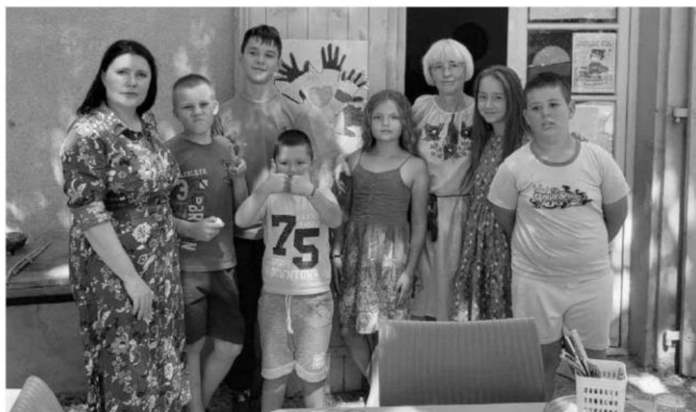
Ukrainiens et Français, ensemble pour créer du lien. [DR]

En cette fin de mois d'août, du 16 au 27 le Domaine de Lascroux centre de vacances de la FOL 81 a accueilli un groupe de jeunes ukrainiens. Cette initiative menée par le service international des PEP dans trois centres de vacances a permis à 17 jeunes de goûter au plaisir d'activités sportives et culturelles. Au niveau départemental, la FOL 81, les PEP et la JPA 81 ont assuré ensemble l'organisation du séjour. La FOL a donc accueilli un groupe de 7 jeunes de 10 à 12 ans encadrés par une psychologue et une traductrice. Ces jeunes viennent de l'oblast de Tcherkassy situé à 190 km au sud est de Kiev. Ils ont été intégrés dans les séjours existants ce qui a permis de développer malgré le problème de la langue de nombreux liens relationnels avec les jeunes français. Nous espérons qu'ils garderont un bon