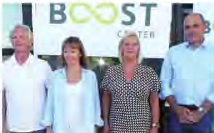
L'équipe du Boost Center, placé sous l'égide de HBA Agglomération, devra patienter un peu pour véritablement relancer l'infrastructure, car d'importants travaux vont être entrepris ces prochaines semaines.

C'est une page qui se tourne sur le plateau d'Hauteville. En proie à des difficultés, le centre sportif H3S implanté ici depuis plus de 35 ans passe la main avec une gestion désormais assurée sous l'égide de Haut Bugey Agglomération. L'offre de séjours devrait se diversifier, notamment en proposant des prestations davantage tournées vers les séjours touristiques ou les comités d'entreprise. Explications.