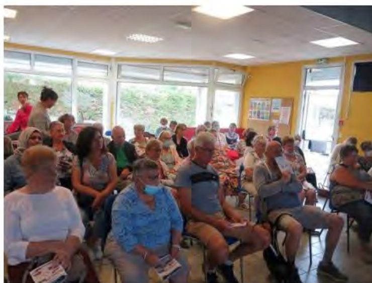
Beaucoup de personnes ont assisté aux réunions de présentations du programme 2022-2023.

Lucé. des nouveautés au centre du Clos Margis. Il y avait beaucoup de monde, mercredi, pour suivre les réunions de présentation du programme 2022-2023 proposés par l'équipe du centre social PEP28 du Clos Margis, à Lucé.