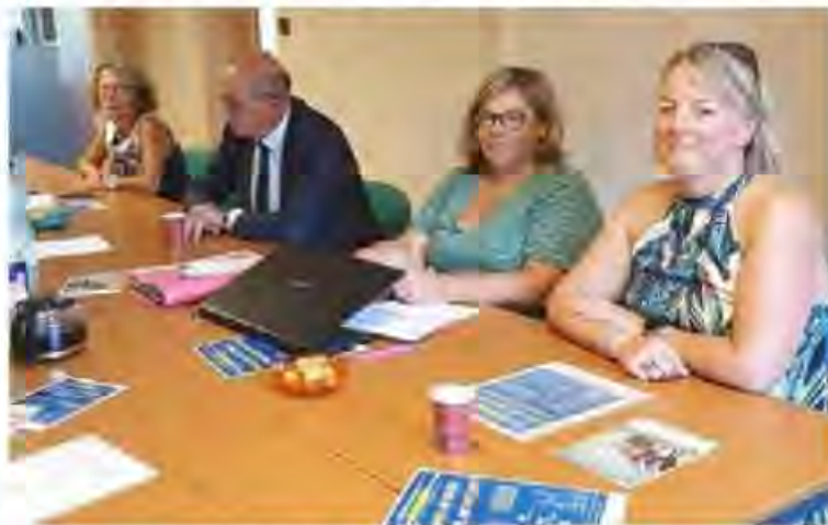
Dernière mise au point avant le forum de samedi.

A 18 h : “Les aides aux départs en vacances” (ANCV).