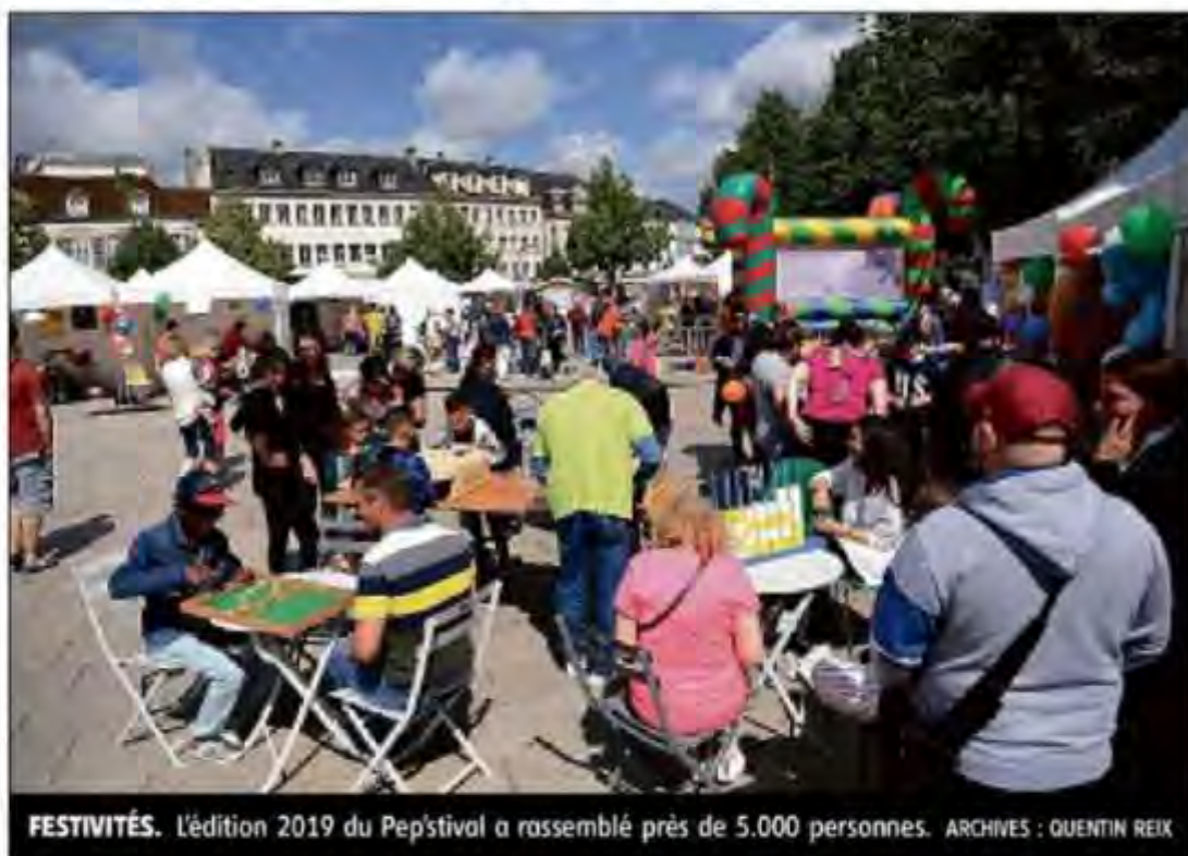
FESTIVITÉS. L'édition 2019 du Pep'stival a rassemblé près de 5.000 personnes.

Les éditions 2020 et 2021 ont été annulées en raison de la crise sanitaire. Pour ce millésime 2022, « 300 salariés et bénévoles de l'association seront présents », c'est deux fois plus que lors de la dernière édition, en 2019. « Cinquante-quatre stands, une structure gonflable et un espace jeux seront déployés », annonce