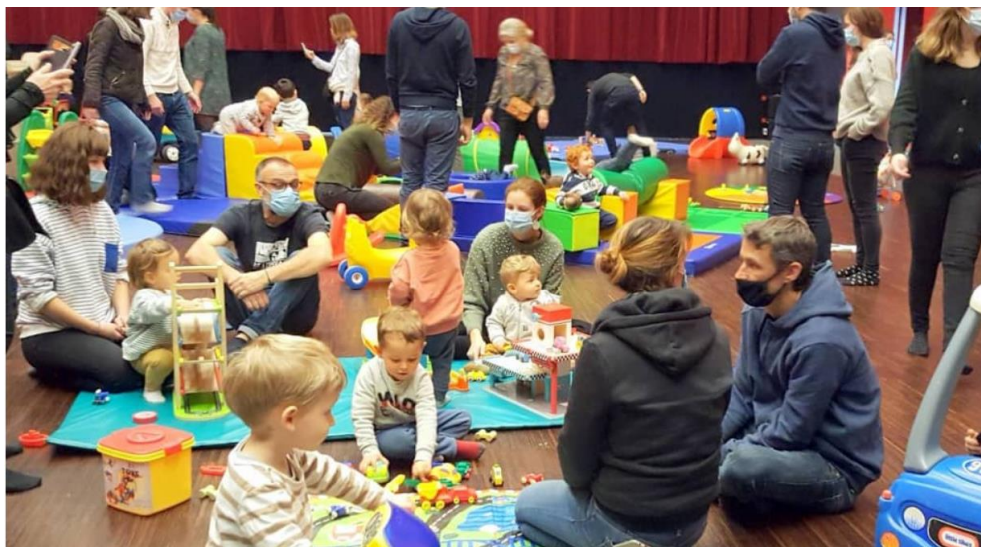
Une centaine de jeux et jouets de toutes sortes mis à la disposition des bambins.