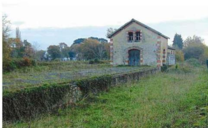
La municipalité va acquérir un terrain de 8 325 m 2 aux abords de la gare.