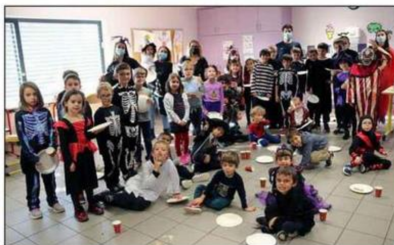
Cinquante-sept enfants, dont les trois-quarts du village, étaient inscrits sur l'ensemble de cette session.

Le temps clément a également permis de nombreuses activités en extérieur. Mercredi a été une journée pyjama-chaussons très appréciée tout comme le succulent goûter servi en clôture de l'accueil de loisirs le vendredi après-midi.