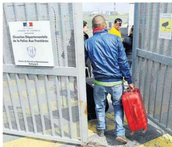
Cet homme a été contraint de laisser femme et enfants à Pamiers.