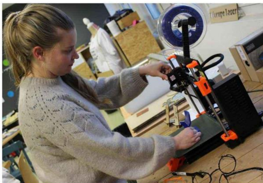
Après chaque atelier, les jeunes inscrit au Passeport cyber-citoyen pourront utiliser les machines du fab lab.

Après une activité, ils auront accès au fab lab. « c'est un pré-texte pour continuer la discussion autour d'une activité ludique. Ils pourront appréhender les machines, se fabriquer un t-shirt avec un message dessus par