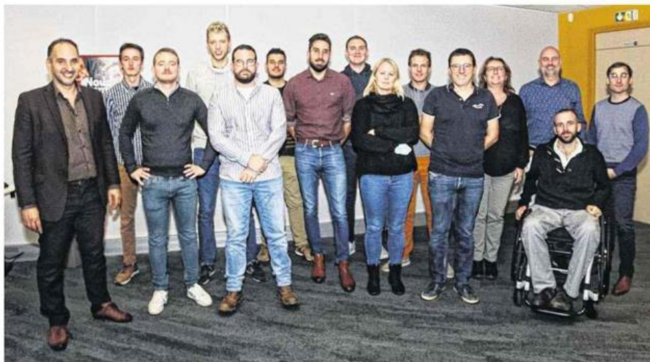
Les apprentis dirigeants de la promotion Normandie 14 travaillent sur le jardin sensoriel de l'IME Colette Yver, sur les Hauts de Rouen.