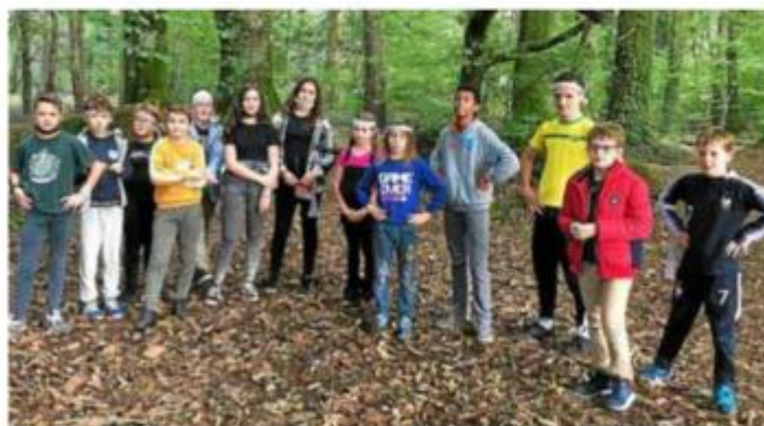
Plus d'un jeune a eu sa minute de frayeur lors du grand jeu zombie dans les bois.

jeux d'arcade et un karaoké. L'incontournable sortie des vacances d'automne à la fête foraine de Vanes a encore remporté un grand succès.