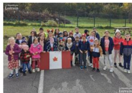
Pour marquer la semaine du goût avec le projet « Voyage autour du monde ».

Quelle meilleure façon d'aborder les coutumes d'un autre pays ■