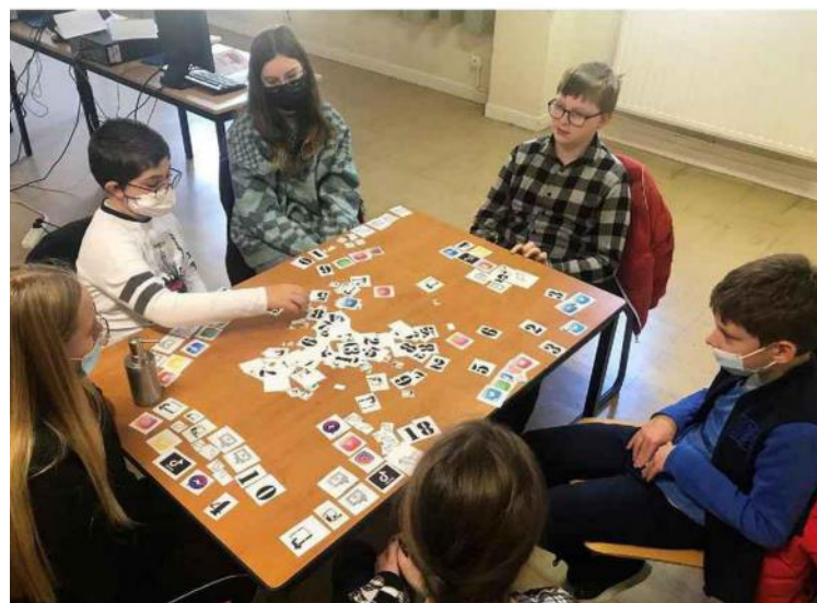
À l'aide de pictogrammes, les jeunes comptent le nombre d'écrans à la maison et les réseaux sociaux qu'ils utilisent.