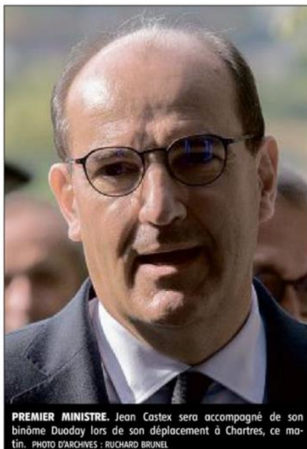
PREMIER MINISTRE. Jean Castex sera accompagné de son binôme Duoday lors de son déplacement à Chartres, ce matin.

Ce matin, à Chartres, le Premier ministre sera non seulement accompagné d'Élisabeth Borne, ministre du Travail, de l'Emploi et de l'Insertion, et de Sophie Cluzel, secrétaire d'État en charge des Personnes handicapées, mais aussi de