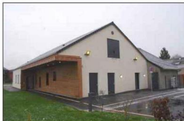
La nouvelle micro-crèche de Fayl-Billot, dont la construction est enfin achevée, va ouvrir ses portes dans les prochains jours.

La micro-crèche qui, à l'instar de sa sœur de Chalindrey, comprend un équipement pédagogique et de puériculture de pointe, s'étend sur une surface totale de 205 m 2 . S'y ajoute, de manière contiguë, le relais d'assistantes mater-