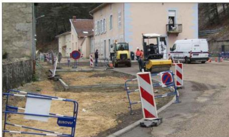
Les travaux avancent rue du Maquis.

En cette fin d'année 2021, quatre chantiers importants étaient en cours sur la commune : trois le sont toujours et un vient de se terminer.