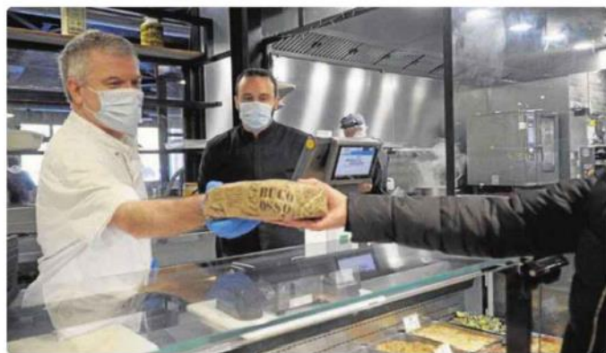
Des personnes de l'Esat "Recur" à Anglet ont été accueillies par la Biocoop pour le "Duo Day".