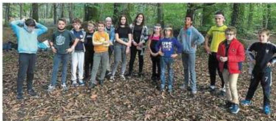
Les jeunes du centre de loisirs ont aimé les animations.