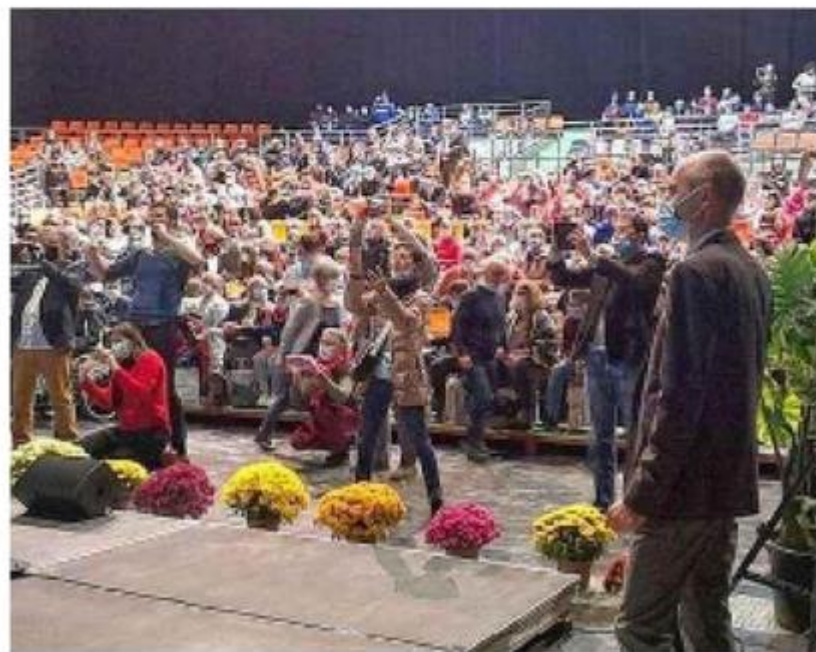
Les nombreux lauréats ont été félicités par leurs collègues.