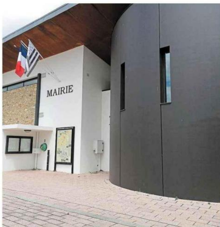
Lors du conseil municipal de Férel, les élus ont décidé de proposer un logement de secours à des personnes en difficultés.

« Si on change de prestataire, les salariés restent les mêmes, je suppose ? » a questionné Corinne Artus, conseillère municipale. « Il n'y a pas d'inquiétude pour les salariés », a