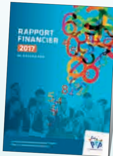
Rapport Financier des PEP 2017