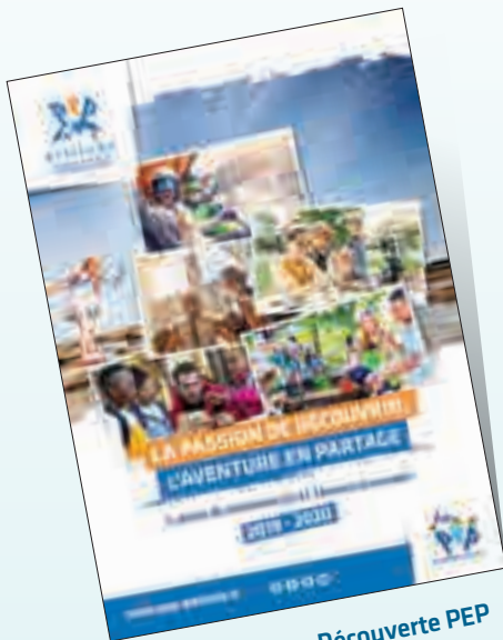
Catalogue Classes Découverte PEP