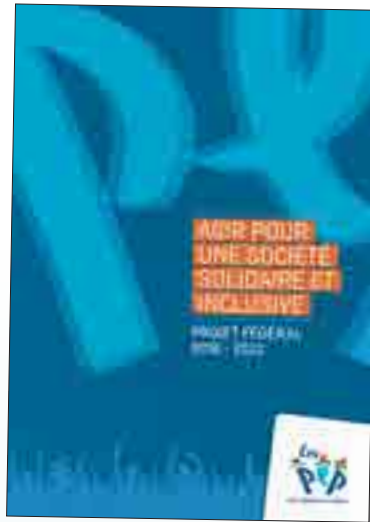
Projet Fédéral PEP