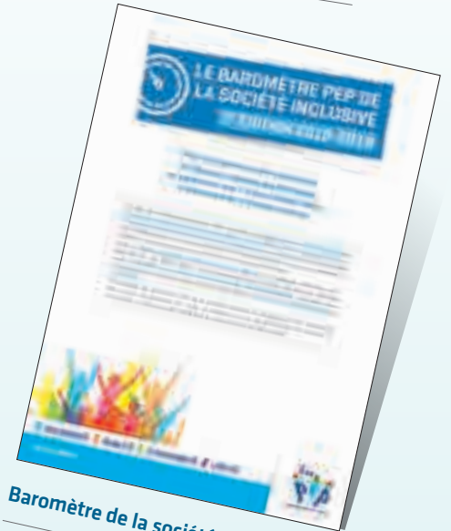
Baromètre de la société inclusive