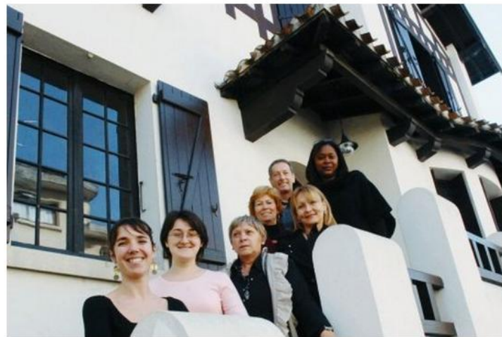
Une équipe multidisciplinaire est à l'écoute des adolescents au 3, rue du Tapis-Vert.

La Maison des ados du Gers vient d'ouvrir à Auch. Un lieu d'écoute, de prévention et d'information.