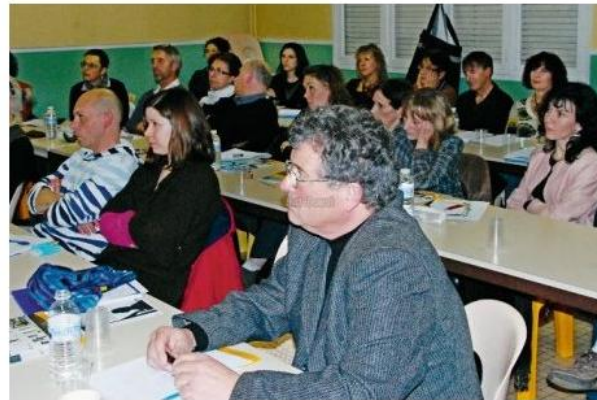
Une assemblée de professionnels attentifs et participatifs.

Le centre Clair Matin a accueilli, lundi et mardi derniers, une trentaine de personnes actrices de la protection de l'enfance (tribunal pour enfants, inspection de l'ASE) ainsi que des responsables et professionnels de MSD, la direction des services AEMO (1).