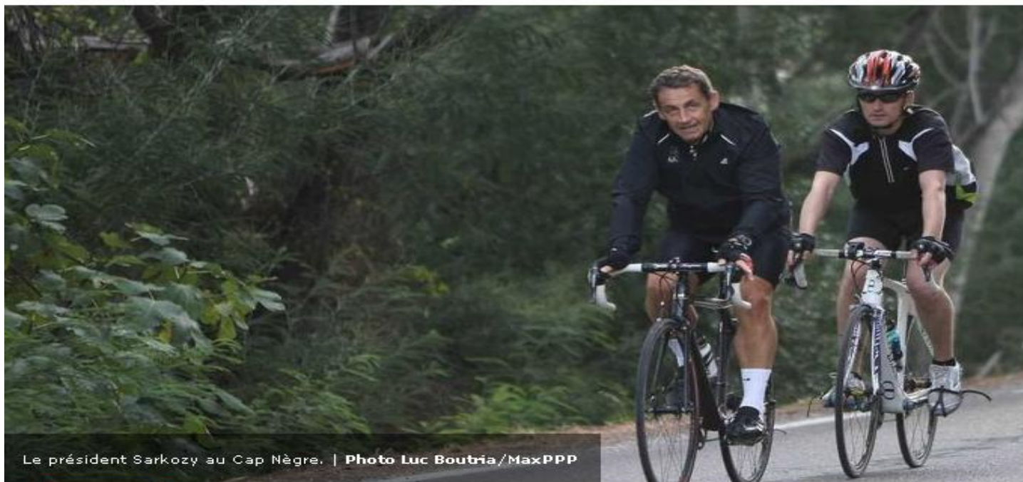
Le président Sarkozy au Cap Nègre.