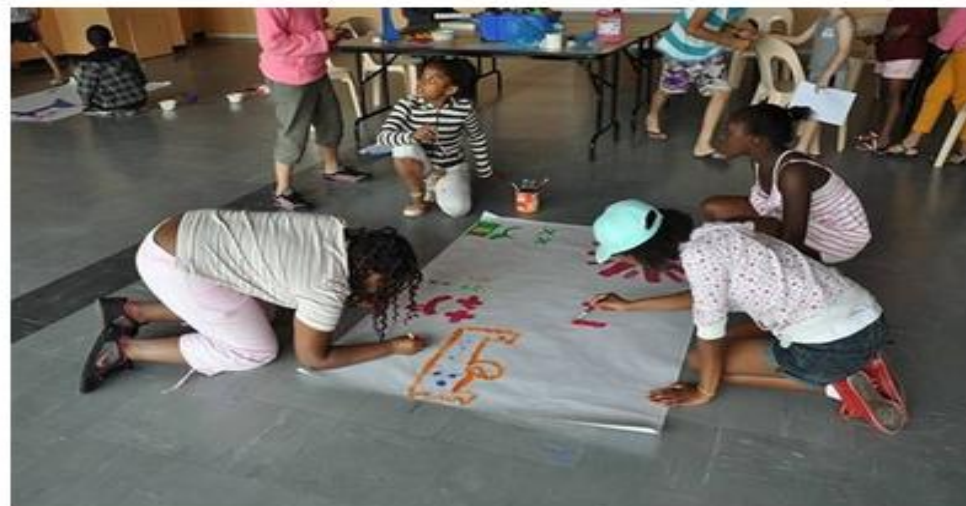
En plus des sorties à la mer, de multiples activités sont prévues pour les enfants.

Faits de société mercredi 06 juillet 2011