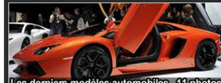
Les derniers modèles automobiles 11 photos