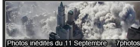
Photos inédites du 11 Septembre 7photos