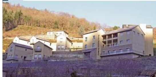
Le Truel. Une 3e structure dans la « maison de retraite »

correspondait pas à ce que les gens espéraient ; les gens basculant du domicile directement vers les EHPAD (établissement d'hébergement pour personnes âgées dépendantes) ».