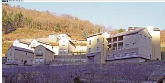
Le Truel. Une 3e structure dans la « maison de retraite »

La « maison de retraite » du Truel, un équipement qui a coûté à la commune 4 millions d'euros et qui reste inoccupée depuis l'achèvement de sa construction en été 2010, aura-t-elle meilleur destin ?