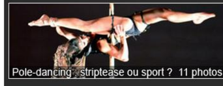
Pole-dancing, striptease ou sport ? 11 photos