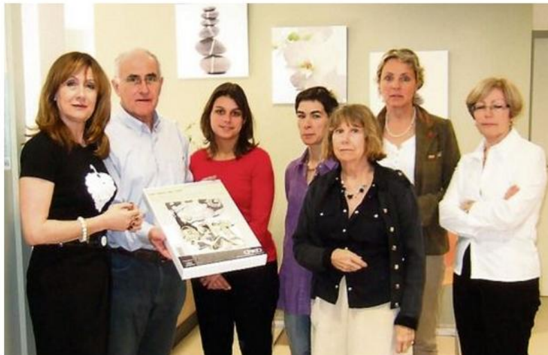
Présentation de la mallette, un outil pédagogique très précieux pour les enfants déficients visuels.