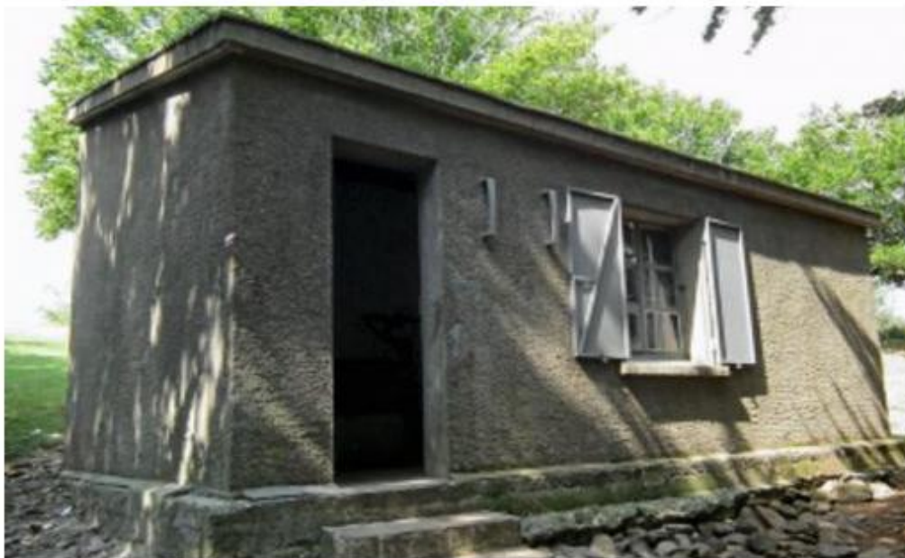
Le refuge de la Tanyarède remis en état.