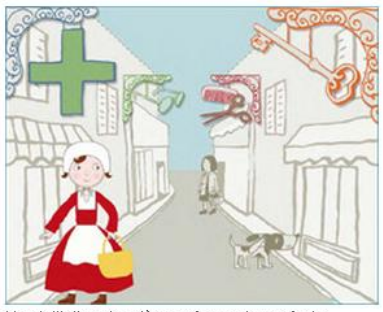
Une initiative pionnière en faveur des enfants handicapés...

À l'initiative du Conseil Local du Handicap du 3e (CLH), ce guide est un outil de médiation culturelle pour les parents d'enfant en situation de handicap, composé d'un livret pour l'enfant, d'un livret pour l'accompagnateur et d'un support sonore.